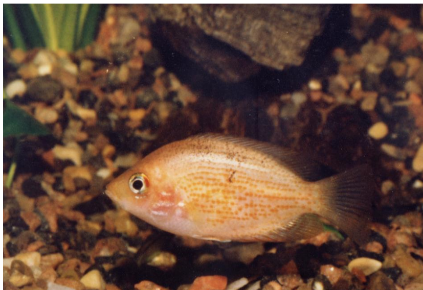
E. maculatus bliver 7 – 8 cm. Mine er ca. 7 cm.

Mine 4 eksemplarer gik helst i samlet flok og spredtes sjældent ret lang tid af gangen. De fandt hurtigt nogle skyggende plantegrupper og trærødder som blev deres faste skjule- og hvilesteder. Når fiskene har disse forhold er de sjældent sky,- og er dermed interessante og sjove at studere.