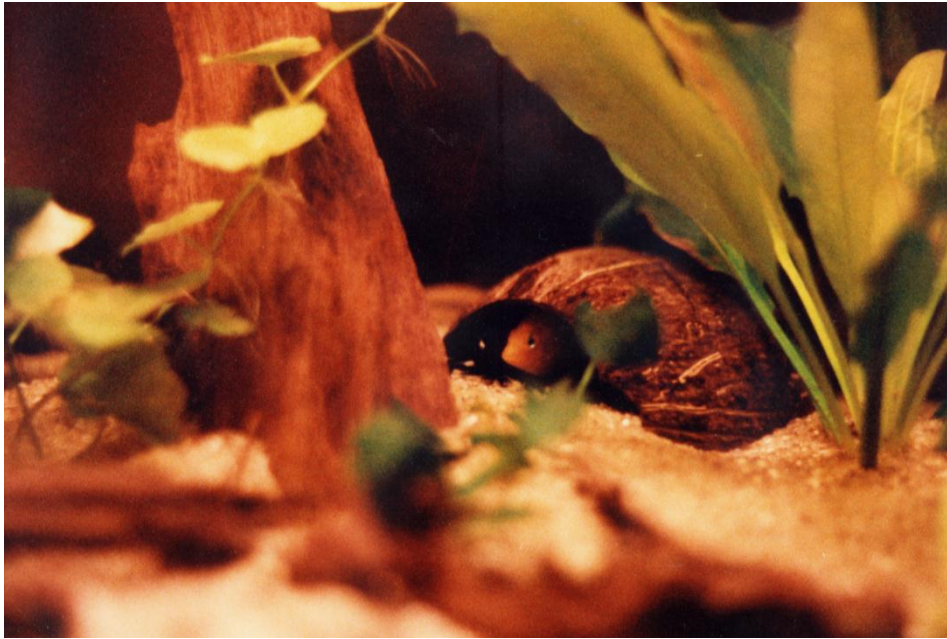
Hannen i skjul under en kokosnøddeskal mens den holder et vågent øje med ungerne